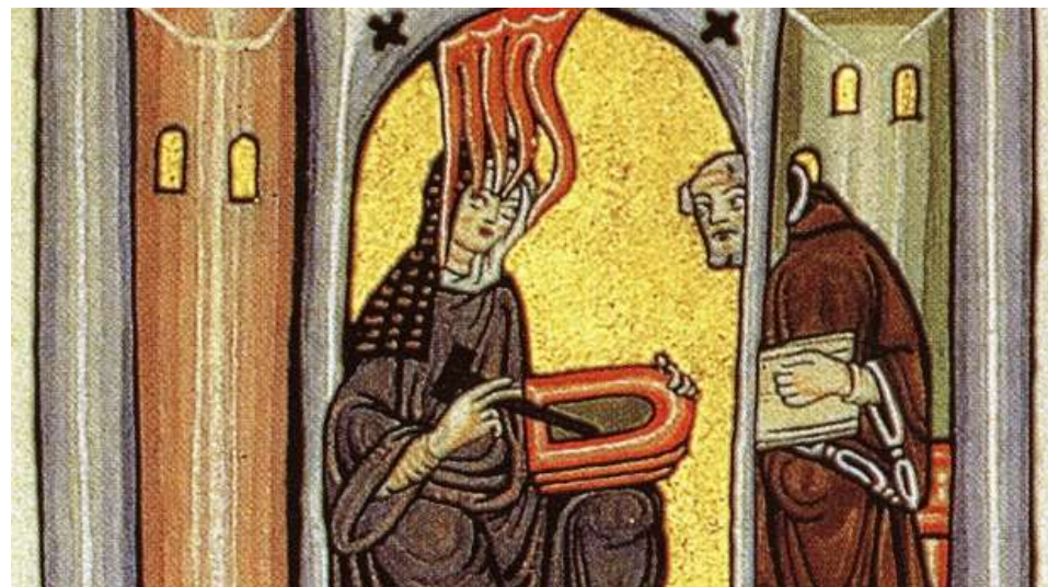
Hildegards illumination af sin kaldelse

Det er ikke en forudsætning, at man har deltaget tidligere.